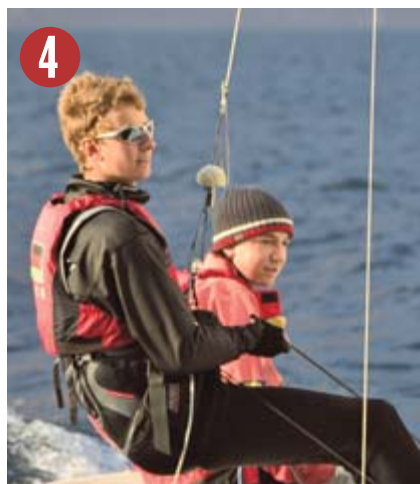
F. und H. Schaal Segel-/Motorbootclub

Teilnahme in der Segel-Optimistenklasse an der Weltmeisterschaft in Neuseeland; Deutscher Meister; Internationaler polnischer Meister; internationaler Schweizer Meister; Internationaler österreichischer Meister; Bayrischer Meister; Landesjugendmeister Baden-Württemberg; European Team-Cup-Sieger auf dem Wannsee.