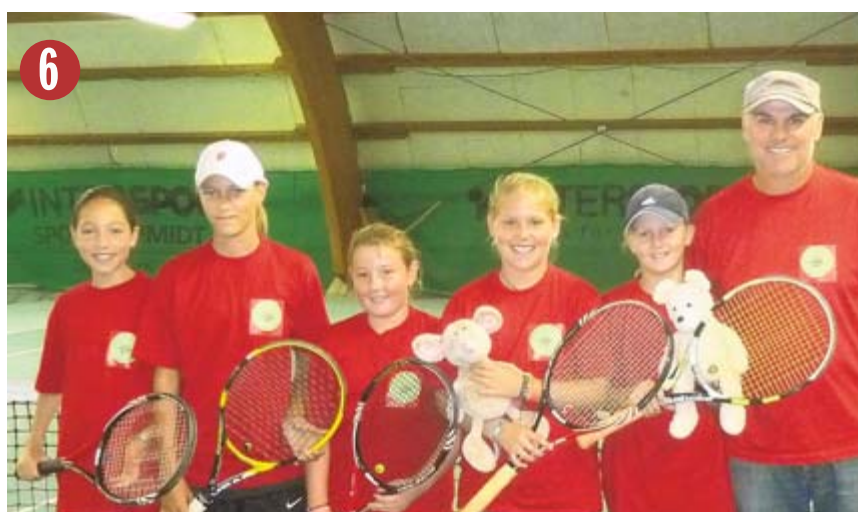
U-12-Tennis-Mädchenmannschaft Tennisclub Überlingen

Angaben bis zum 17. Februar 2012, 14 Uhr, an SÜDKURIER, Mühlenstraße 6, 88662 Überlingen, schicken, Fax: 0 75 51/80 97 72 91; E-Mail: ueberlingen.redaktion@suedkurier.de Der Rechtsweg ist ausgeschlossen.