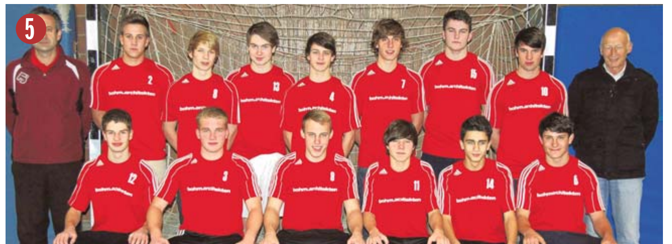
Fußballmannschaft B-Junioren FC 09 Überlingen

Teilnahme in der Bootklasse 420 an der Welt- und Europameisterschaft in Argentinien und in Portugal. Teilnahme an der Kieler Woche und am Young European Sailing in Kiel.